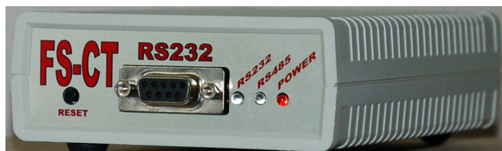
Рисунок 1: Передняя панель контроллера

На передней панели расположены индикаторы питания и активности интерфейсов RS232, RS485.