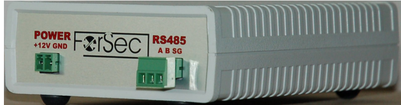
Рисунок 2: Обратная сторона контроллера FS-CT

На обратной стороне корпуса расположен терминальный блок для подключения к сети RS485. Сеть представляет собой экранированную витую пару. Контакты А и В одной панели подключаются к соответствующим контактам А и В другой панели. Контакт SG(сигнальное заземление) используется для подключения экрана. Для обеспечения максимальной устойчивости системы экран на одном из концов сегмента сети рекомендуется заземлить.